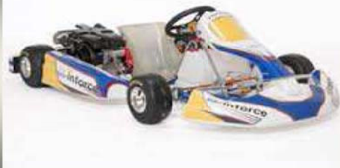
フレーム: birel / TIA エンジン: YAMAHA / MZ200